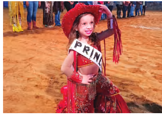
AS DONAS DA FESTA ACOMPANHADAS