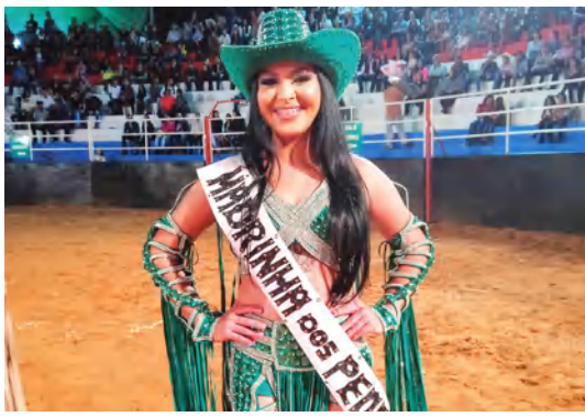
PRINCESAS, RAINHAS E MADRINHAS