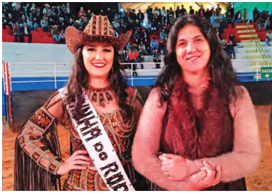
AS DONAS DA FESTA ACOMPANHADAS