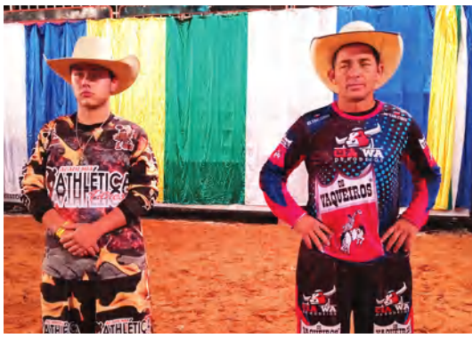
EQUIPE CIA WA