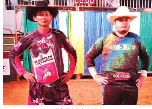
EQUIPE CIA WA