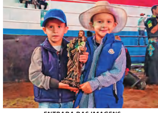
ENTRADA DAS IMAGENS