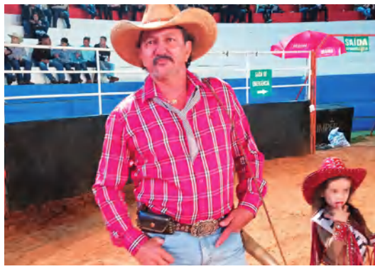
EQUIPE CIA WA