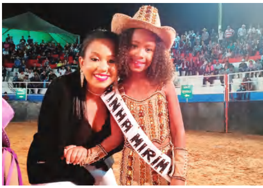
PRINCESAS, RAINHAS E MADRINHAS