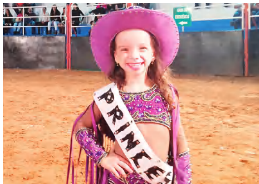
PRINCESAS, RAINHAS E MADRINHAS