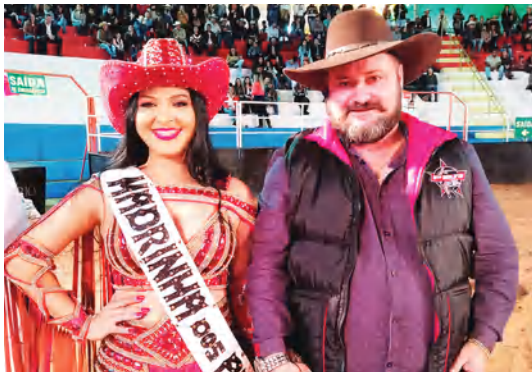
AS DONAS DA FESTA ACOMPANHADAS