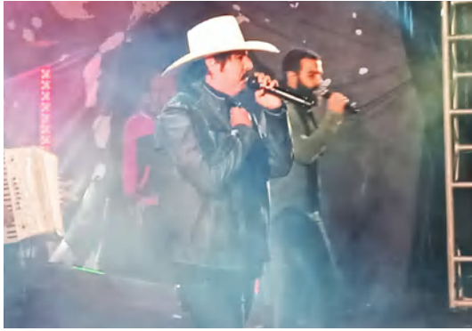
FIDUMA & JECCA