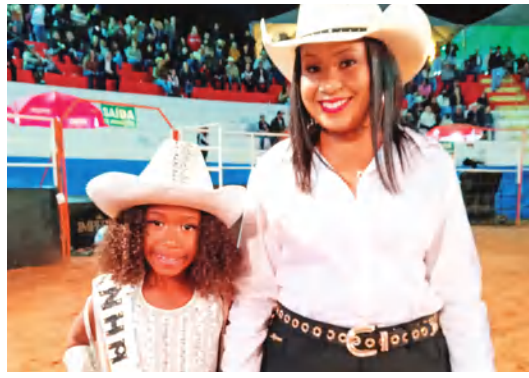
AS DONAS DA FESTA ACOMPANHADAS