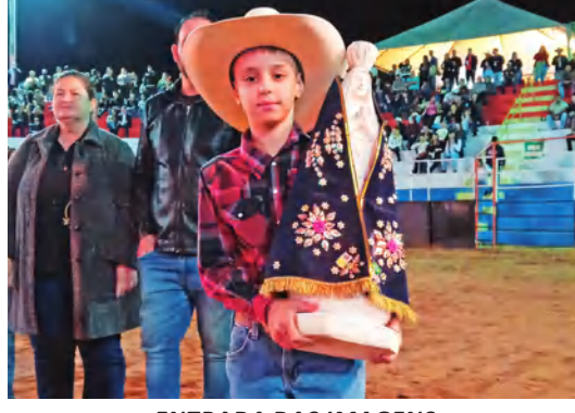
ENTRADA DAS IMAGENS