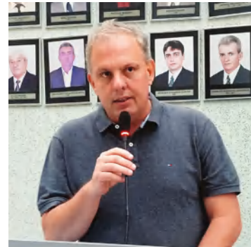
PREFEITO MAURÍCIO LOFRANO