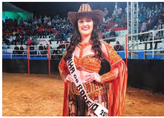
PRINCESAS, RAINHAS E MADRINHAS