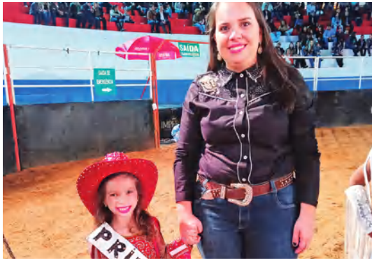
AS DONAS DA FESTA ACOMPANHADAS