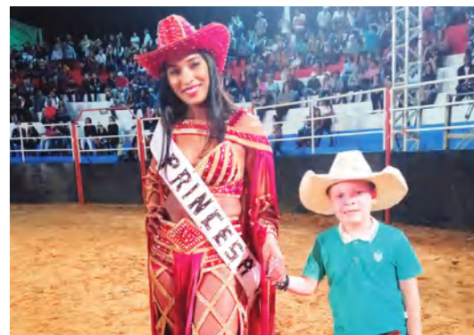
PRINCESAS, RAINHAS E MADRINHAS