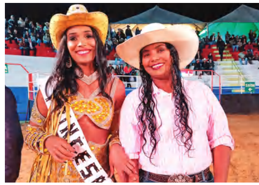
AS DONAS DA FESTA ACOMPANHADAS