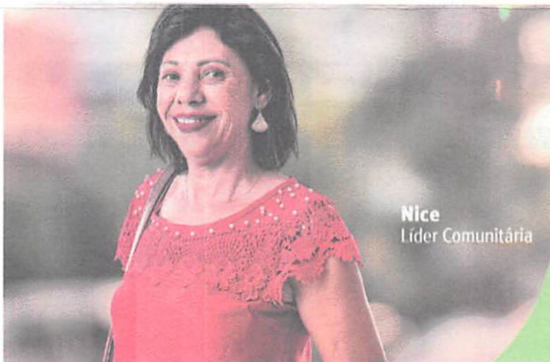
Nice Líder Comunitária